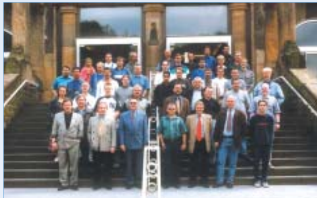
Die Mitarbeiter der Carl Lechner GmbH im Jahr 2000