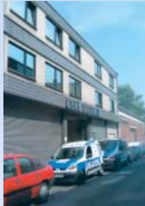
Der Firmensitz auf der Vinzenzstraße 15 in Krefeld. Von hier aus sind 27 Firmenfahrzeuge im Einsatz.