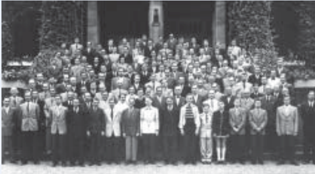
Die Mitarbeiter beim 75-jährigen Jubiläum 1953

Am 7. Juli 1953 feiert die Firma Carl Lechner ihr 75-jähriges Bestehen im Stadtwaldhaus zu Krefeld. Der Wiederaufbau an der Rheinstraße 15 ist vollendet. Eine kleine bunte Festschrift wird erstellt.